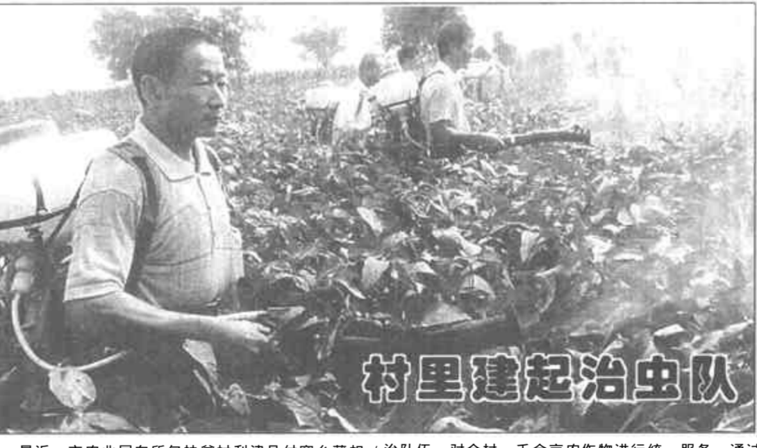
最近, 市农业局向所包贫困村利津县付窝乡扣村无偿赠送7台背负式喷雾喷粉机和部分药品, 帮助该村建立起一支具有快速反应能力的机械化病虫害防治队伍, 对全村一千余亩农作物进行统一服务。通过试验, 病虫害防治大大优于一家一户自治的效果, 具有省力、省工、省钱的优点。